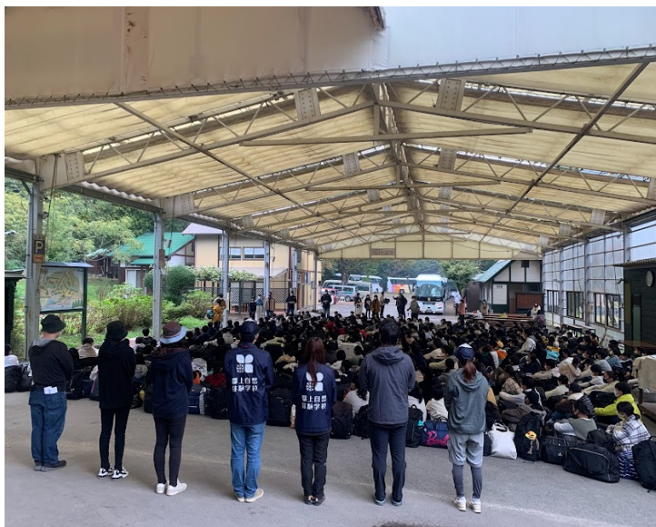
テント下式の様子

※雨天時の式がテント下の場合はバスはテント下の奥(屋根はありません)に停めていただきます。 ※雨天時の式は信定ホールをオススメしております。