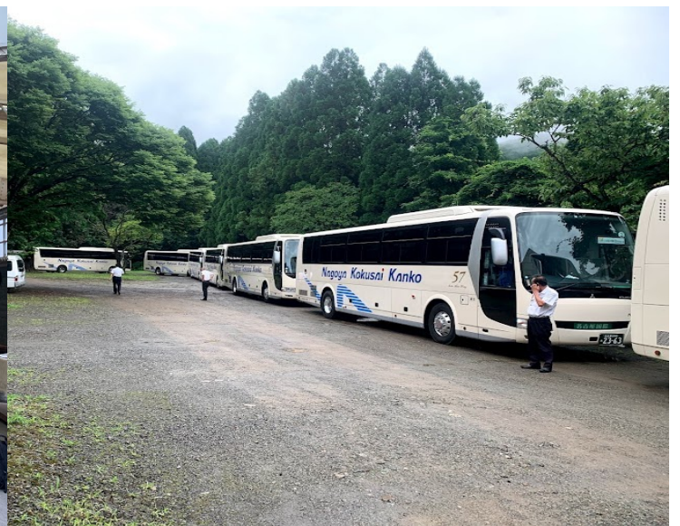
テント下奥駐車スペース